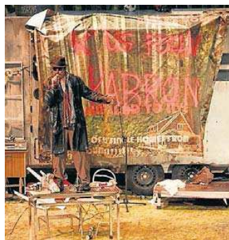
A Jerusalem Pere Arquillué interpreta l'antiheroi Johnny el Gall.