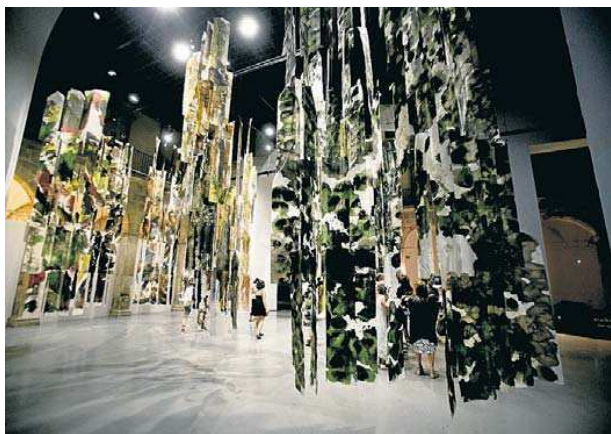
El bosc dels arquitectes d'Olot està fet amb paper artesanal. PERE TORDERA